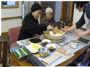
流行の恵方巻き 買うと高いので 手作りします